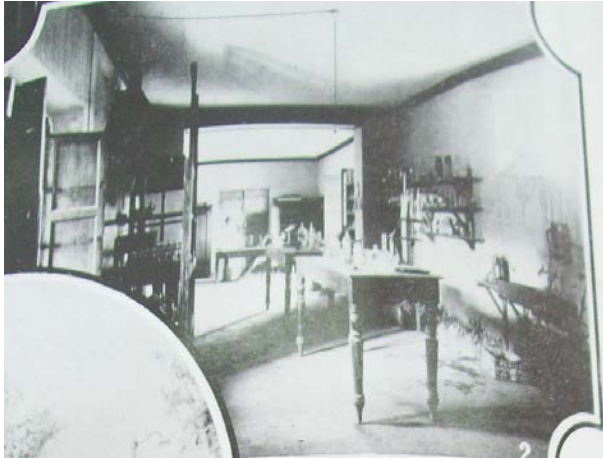
Figura 2: Laboratorio y Bodega Modelo de la Escuela Nacional de Vitivinicultura