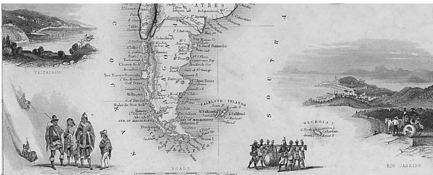
Suramérica (detalle), 1860 | Colección: Pablo Navas | ARCHIVO: BIBLIOTECA NACIONAL DE COLOMBIA

Los libros publicados por Ford en el ciclo democrático iniciado en 1983 y hasta su muerte (1987a, 1994, 1999, entre otros) se caracterizaron por la combinación del género del ensayo, el estudio erudito, el relato cultural, la sistematización periodística de información nacional e internacional, y fueron resultado de su actuación como profesor en las instituciones universitarias, pero también como especialista invitado en distintos seminarios nacionales e internacionales sobre comunicación y cultura y otras temáticas, en los que tuvo estrecho con-