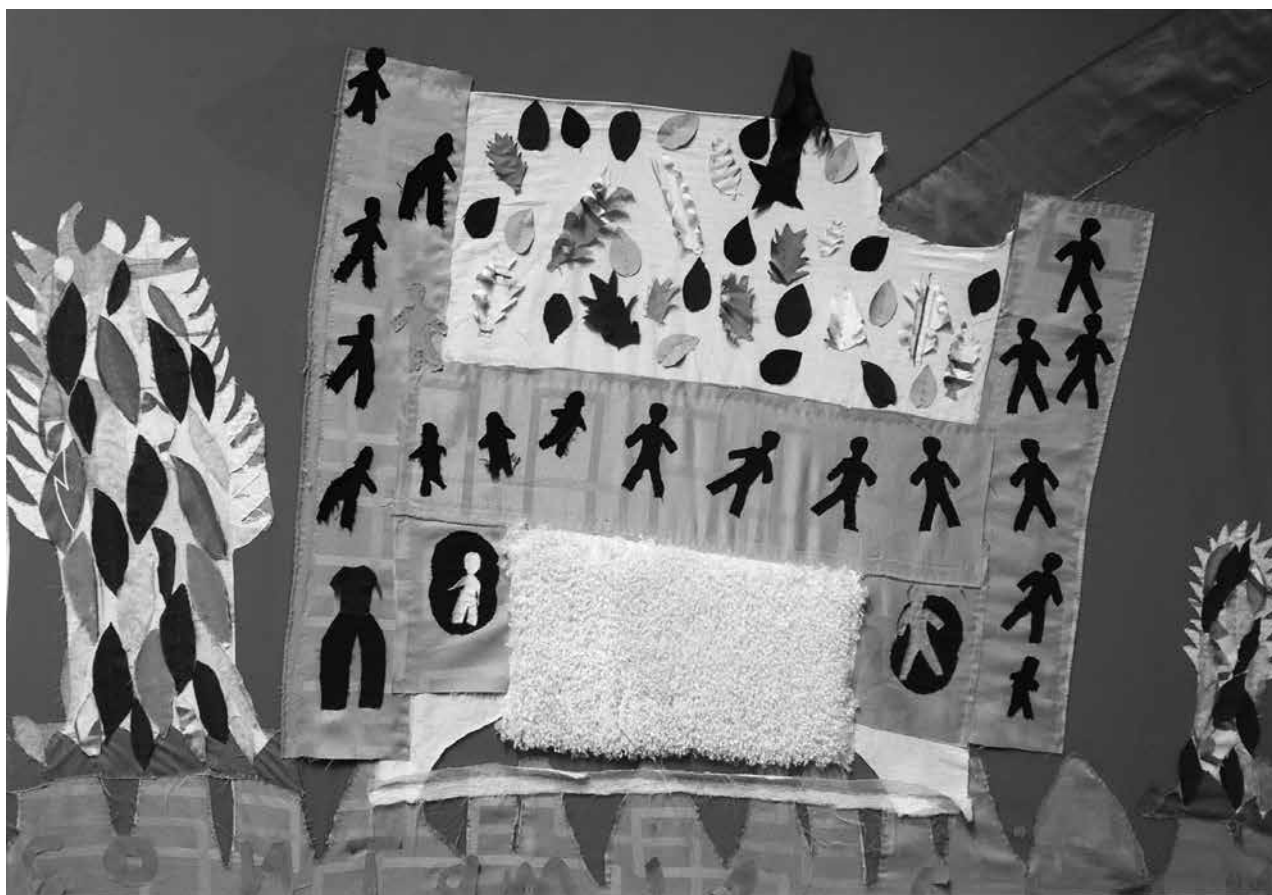
El Costurero de la memoria, exposición de cartografía de la memoria, Bogotá, 2014

las ciencias de la comunicación, de constitución más reciente, han tenido un desigual tratamiento y reconocimiento desde el punto de vista académico, y una institucionalización tardía o en curso. Recurriendo a Becher (2001), podríamos afirmar que, mientras las primeras corresponderían al dominio del conocimiento “blando puro” y a estructuras convergentes y redes tupidas, las segundas corresponderían al conocimiento “blando aplicado”, con estructuras divergentes y redes más flojas y con un mayor contacto con “territorios colindantes” o “áreas de conocimiento vecinas”. Detenernos en estas disciplinas, que presentan algunas problemáticas y dilemas comunes, explorando en una segunda instancia las obras de referentes destacados que se han desempeñado en la producción y transmisión del conocimiento en el espacio universitario y en otros ámbitos, permitirá reconocer la existencia en las ciencias sociales de diversas mixturas y combinaciones entre imaginarios sociales y políticos y producción académica.