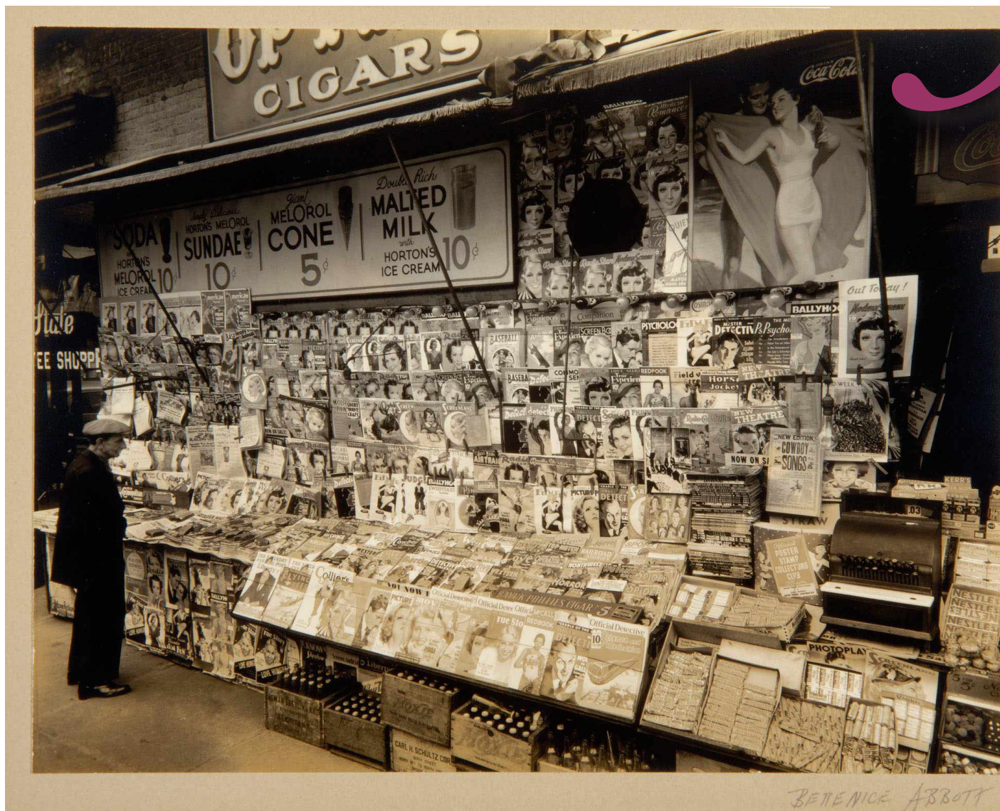
Berenice Abbott, Newsstand, 32nd Street and Third Avenue, 1935